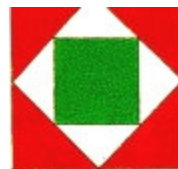
Repubblica Italiana 1802-1805