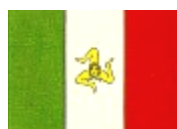
Governo provvisorio della Sicilia 1848-1849