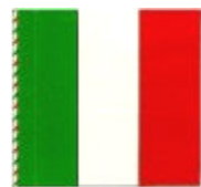
Repubblica Cisalpina 1797-1802

La maggior parte non sopravvisse alla controffensiva austro-russa del 1799, altre confluirono, dopo la seconda campagna d'Italia, nel Regno Italico, che sarebbe durato fino al 1814. Tuttavia, esse rappresentano la prima espressione di quegli ideali di indipendenza che alimentarono il nostro Risorgimento. E fu proprio in quegli anni che la bandiera venne avvertita non più come segno dinastico o militare, ma come simbolo del popolo, delle libertà conquistate e, dunque, della nazione stessa.