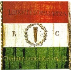
Repubblica Cispadana 1796-1797

La prima campagna d'Italia, che Napoleone conduce tra il 1796 e il 1799, sgretola l'antico sistema di Stati in cui era divisa la penisola. Al loro posto sorgono numerose repubbliche giacobine, di chiara impronta democratica: la Repubblica Ligure, la Repubblica Romana, la Repubblica Partenopea, la Repubblica Anconitana.