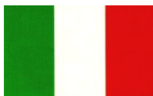
Repubblica Italiana 2 giugno 1946

Il 14 marzo 1861 venne proclamato il Regno d' Italia e la sua bandiera continuò ad essere, per consuetudine, quella della prima guerra d' indipendenza. Ma la mancanza di una apposita legge al riguardo - emanata soltanto per gli standardi militari - portò alla realizzazione di vessilli di foggia diversa dall' originaria, spesso addirittura arbitrarie. Soltanto nel 1925 si definirono, per legge, i modelli della bandiera nazionale e della bandiera di Stato. Quest' ultima (da usarsi nelle residenze dei sovrani, nelle sedi parlamentari, negli uffici e nelle rappresentanze diplomatiche) avrebbe aggiunto allo stemma la corona reale. Dopo la nascita della Repubblica, un decreto legislativo presidenziale del 19 giugno 1946 stabilì la foggia provvisoria della nuova bandiera, confermata dall' Assemblea Costituente nella seduta del 24 marzo 1947 e inserita all' articolo 12 della nostra Carta Costituzionale. E perfino dall' arido linguaggio del verbale possiamo cogliere tutta l' emozione di quel momento. PRESIDENTE [Ruini] Pongo ai voti la nuova formula proposta dalla Commissione: "La bandiera della repubblica è il tricolore italiano: verde, bianco e rosso, a bande verticali e di eguali dimensioni". (E' approvata. L' Assemblea e il pubblico delle tribune si levano in piedi. Vivissimi, generali, prolungati applausi.)