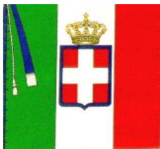
Regno di Sardegna (1848-1861) e Regno d' Italia (1861-1946)

Nei tre decenni che seguirono il Congresso di Vienna, il vessillo tricolore fu soffocato dalla Restaurazione, ma continuò ad essere innalzato, quale emblema di libertà, nei moti del 1831, nelle rivolte mazziniane, nella disperata impresa dei fratelli Bandiera, nelle sollevazioni negli Stati della Chiesa. Dovunque in Italia, il bianco, il rosso e il verde esprimono una comune speranza, che accende gli entusiasmi e ispira i poeti: "Raccogliaci un' unica bandiera, una speme", scrive, nel 1847, Goffredo Mameli nel suo Canto degli Italiani. E quando si dischiuse la stagione del '48 e della concessione delle Costituzioni, quella bandiera divenne il simbolo di una riscossa ormai nazionale, da Milano a Venezia, da Roma a Palermo. Il 23 marzo 1848 Carlo Alberto rivolge alle popolazioni del Lombardo Veneto il famoso proclama che annuncia la prima guerra d' indipendenza e che termina con queste parole: "(...) per viemmeglio dimostrare con segni esteriori il sentimento dell' unione italiana vogliamœ che le Nostre Truppe (...) portino lo Scudo di Savoia sovrapposto alla Bandiera tricolore italiana." Allo stemma dinastico fu aggiunta una bordatura di azzurro, per evitare che la croce e il campo dello scudo si confondessero con il bianco e il rosso delle bande del vessillo.